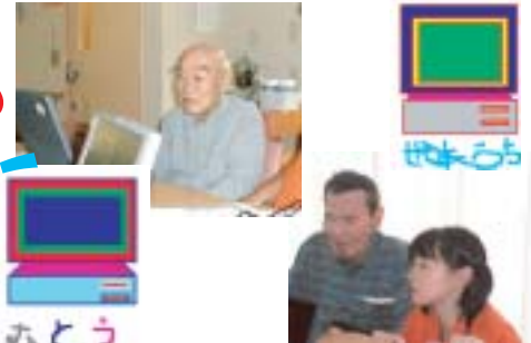
デイサービスセンターの講座風景

日時：【10月コース】(パソコンの基礎) 10/6(水)・13(水)・20(水)・27(水)